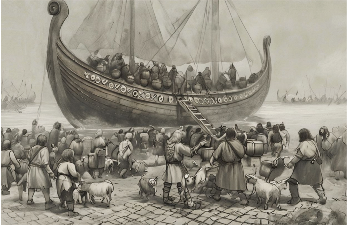
Wikinger, KI-generiert