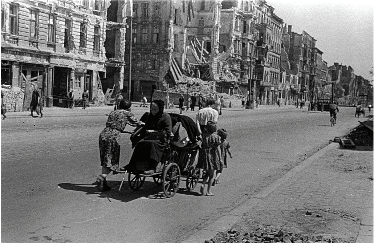
Umsiedler in Berlin, 1945/46