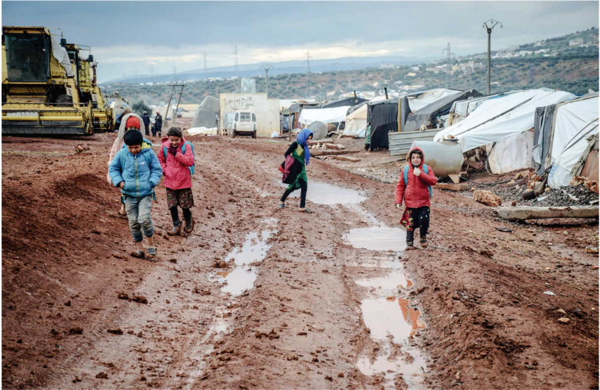
Syrische Kinder im Flüchtlingslager, 2021