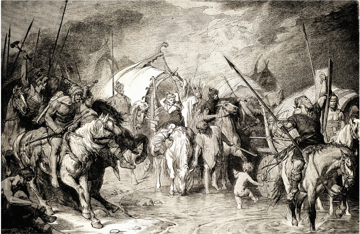
Auswanderung der Germanen, Juan Scherr, Zweitausend Jahre deutsche Geschichte, 1882